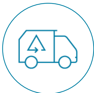
RECOGIDA DE RESIDUOS